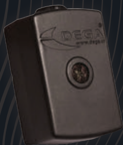
DEGA Zc II externí záplavové čidlo