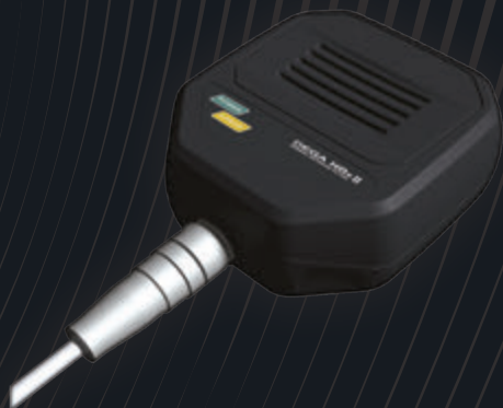
DEGA NBx-yL II přídatný snímač detekce plynů